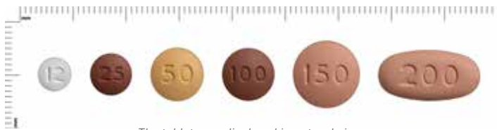
The tablets are displayed in natural size.